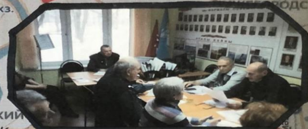
Совет Ветеранов Войны