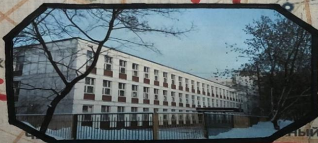
ГБОУ Школа №1862 здание №10