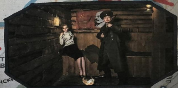
Квест «1941 Битва за Москву»