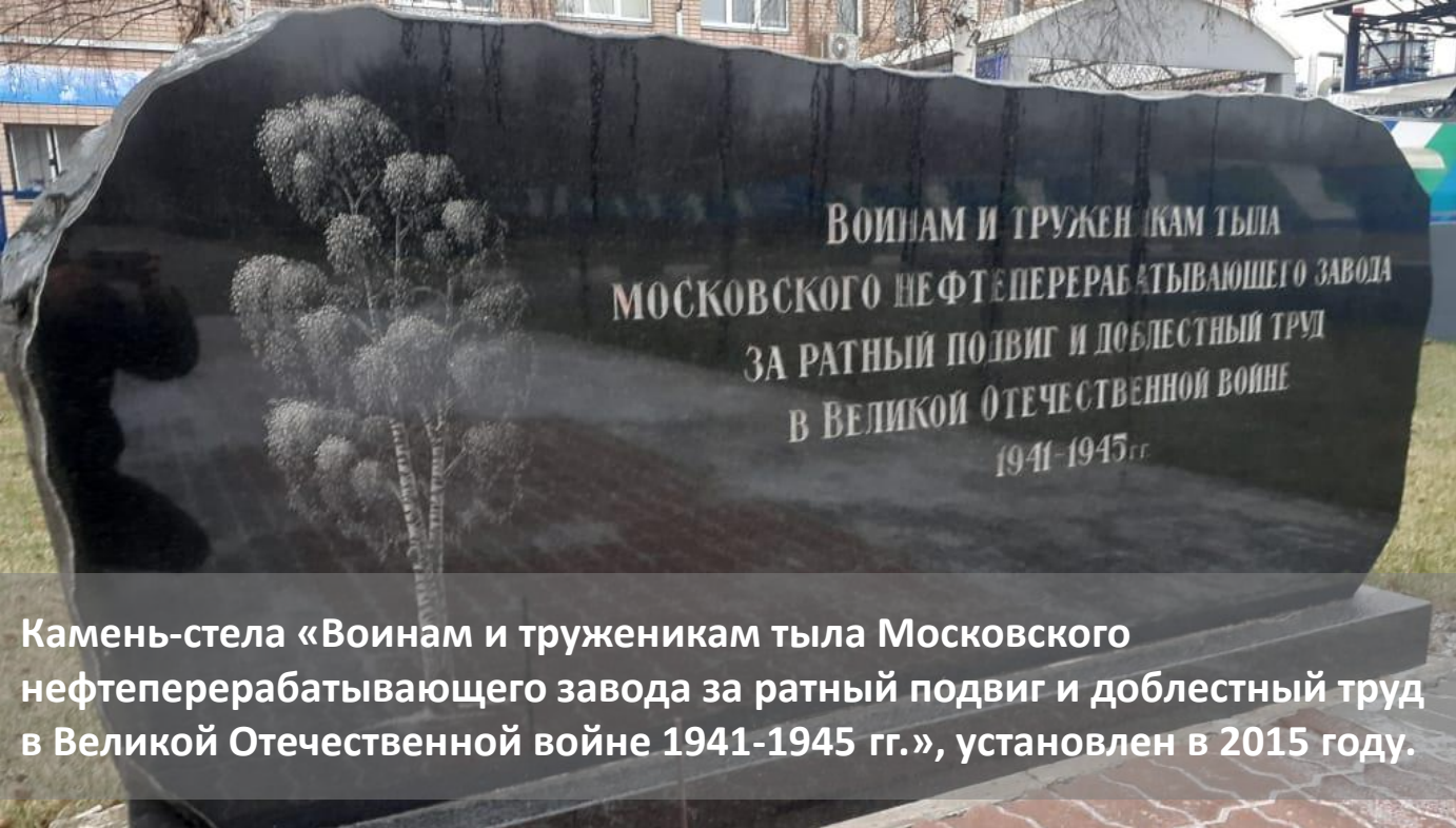
Камень-стела «Воинам и труженикам тыла Московского нефтеперерабатывающего завода за ратный подвиг и доблестный труд в Великой Отечественной войне 1941-1945 гг.», установлен в 2015 году.

Большинство мужчин-рабочих призвали в армию. На их место встали женщины и подростки. Именно на их долю выпали самые сложные испытания. Им пришлось осваивать мужские специальности. В военные годы на предприятии трудилось больше 430 женщин! И завод не просто работал, а активно наращивал объемы и развивал технологии производства. Работали в несколько смен, круглыми сутками.