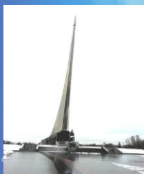
Обелиск Покорителям Космоса

К 2017 году было установлено 14 памятников выдающимся деятелям космонавтики.