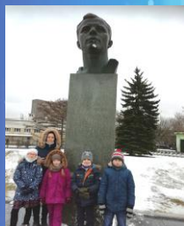
Бронзовый бюст Ю.А. Гагарина