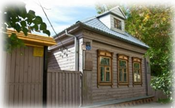
Дома-музеи великих деятелей науки в Клине