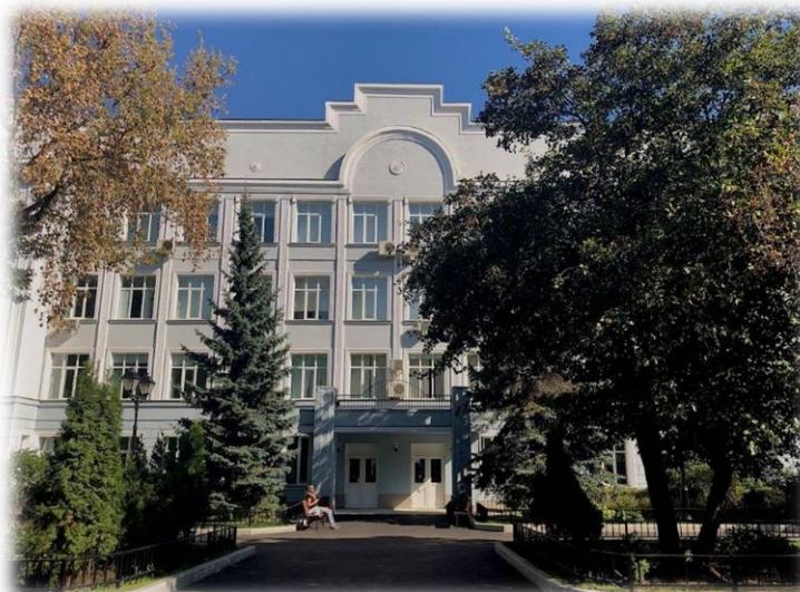
Сергиев Посад, село Абрамцево