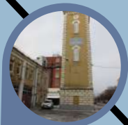
Пожарная каланча пожарной части №3