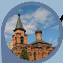
Храм Свт. Митрофана Воронежского