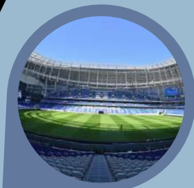
Центральный стадион "Динамо" им. Л.И. Яшина