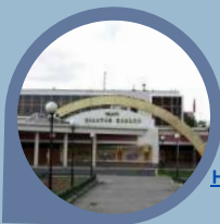
Национальный театр народной музыки и песни "Золотое кольцо"