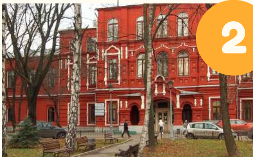
больница братьев Бахрушиных