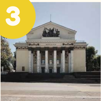
Дворец на Яузе