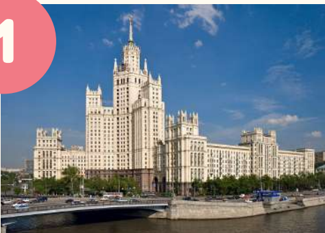
дом на котельнической набережной