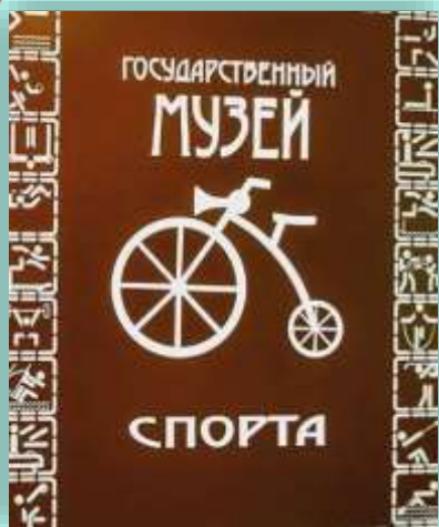
Государственный музей спорта