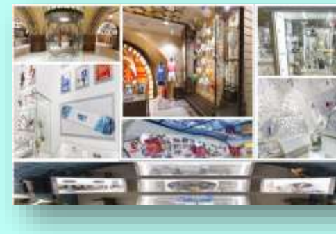
Выставочные залы музея спорта