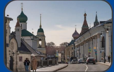
Улица Варварка (XIV век)