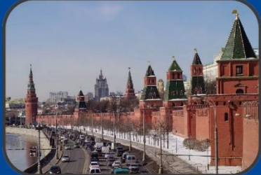
Московский Кремль (XV век)