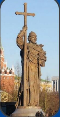
Памятник Владимиру Великому (X век)