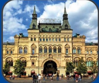
ГУМ (XVII век)