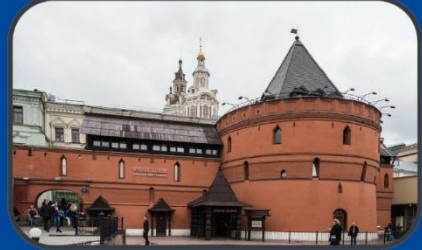
Китайгородская стена (XVI век)