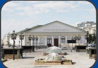
Центральный выставочный зал Манеж