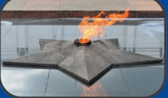
Могила Неизвестного Солдата (XX век)