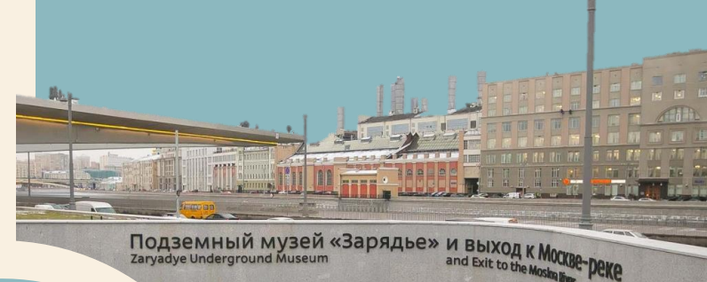
Подземный музей «Зарядье» и выход к Москве-реке Zaryadye Underground Museum and Exit to the Moskva River

исторической значимостью, но и современным оснащением.