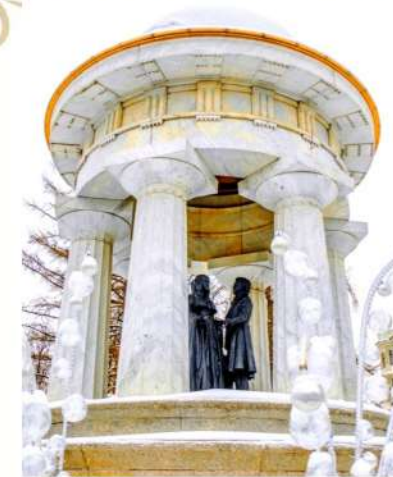
Фонтан Ротонда "Наталья и Александр". Скульптор М. Дронов. Открыт в 1999 г в честь 200-летнего юбилея А.С. Пушкина. (ул. Большая Никитская 36)

В старинном особняке середины XVIII века, в самом сердце столицы – на Тверском бульваре расположен Московский Драматический театр имени Пушкина, который имеет полную значительных творческих побед историю (Тверской бульвар 23)