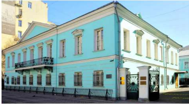
Мемориальная квартира А.С. Пушкина. Включена в список памятников культуры государственного значения. (Ул. Арбат д.53)