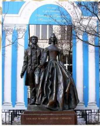
Памятник Александру Пушкину и Наталье Гончаровой на Арбате. Запечатлен момент торжественного выхода после венчания. (Ул. Арбат д.46)