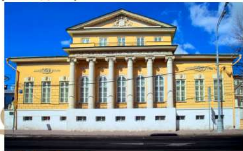
Главное здание Государственного музея А.С. Пушкина в бывшей усадьбе Хрущевых-Селезневых. (улица Пречистенка, дом 12/2)

Москва... как много в этом звуке Для сердца русского слилось! Как много в нем отозвалось