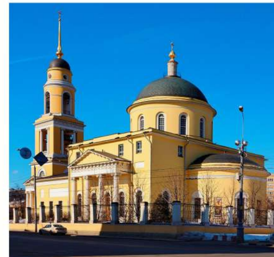
Храм Вознесения Господня в Сторожах или Большое Вознесение. Именно здесь в 1831 году венчались Александр Пушкин и Наталья Гончарова. (Ул. Большая Никитская д.36)