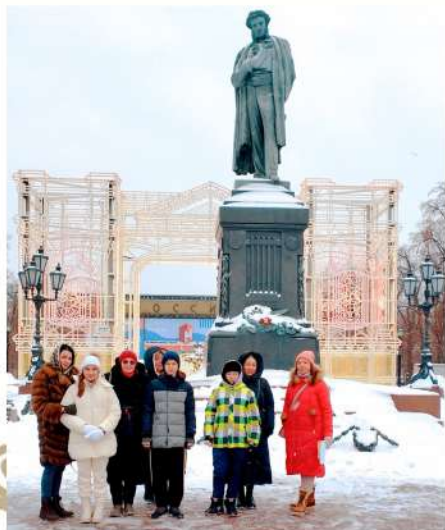
Памятник А.С. Пушкину. Скульптор А.М. Опекушин (Пушкинская площадь)