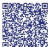
Схема культурно-познавательного маршрута