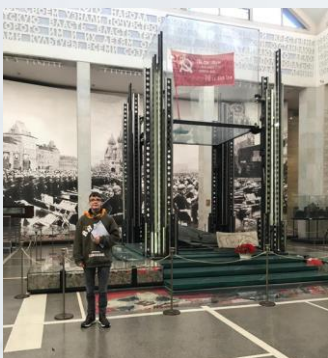
Центральный музей Вооруженных сил

С ребятами на экскурсии находились взрослые, которые оказывали необходимую помощь.