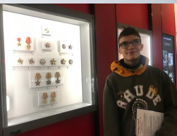
Музей современной истории России

Музеи хранят память о героической истории нашего народа. Каждый, кто приходит в эти музеи, может прикоснуться к славным страницам нашего великого прошлого и отдать дань уважения всем защитникам Отечества.